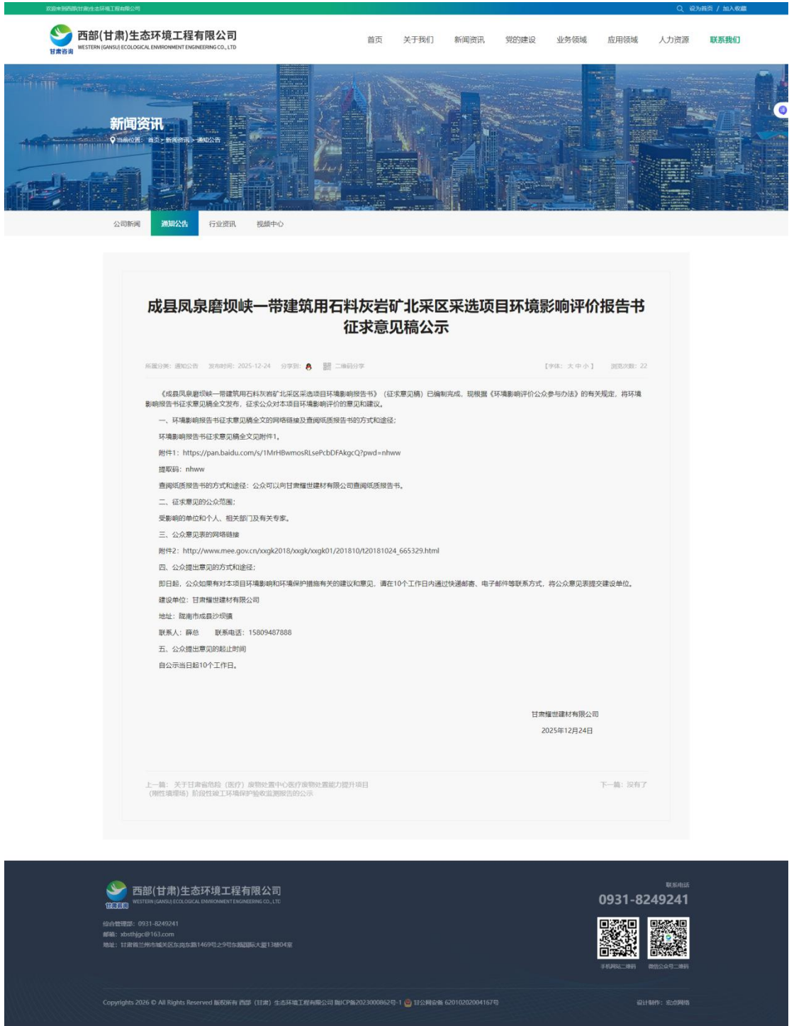
征求意见稿公示截图

），同时附报告书征求意见稿和公众意见表的下载链接，以便公众查阅并提出意见，征求意见期限为 10 个工作日。第二次网络公示截图见图 2。